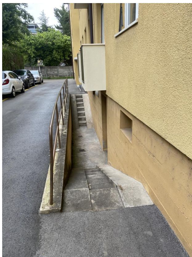
Accès direct sous-sol