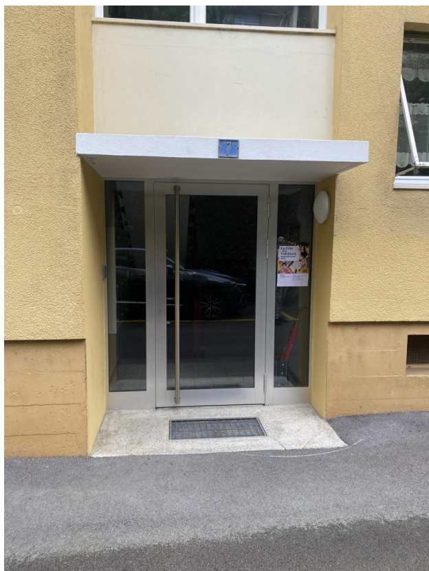
Entrée no 7