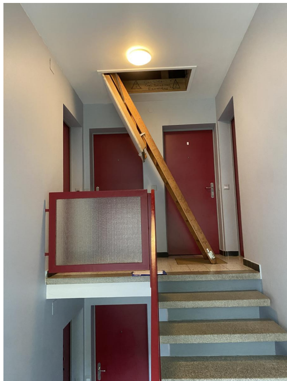
Trappe d'accès aux combles