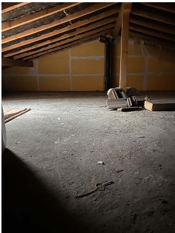
Aperçu mur mitoyen