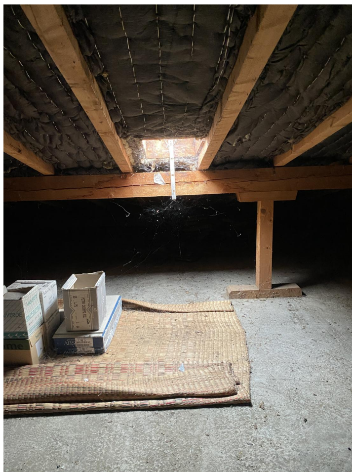
Aperçu sous-face de toiture