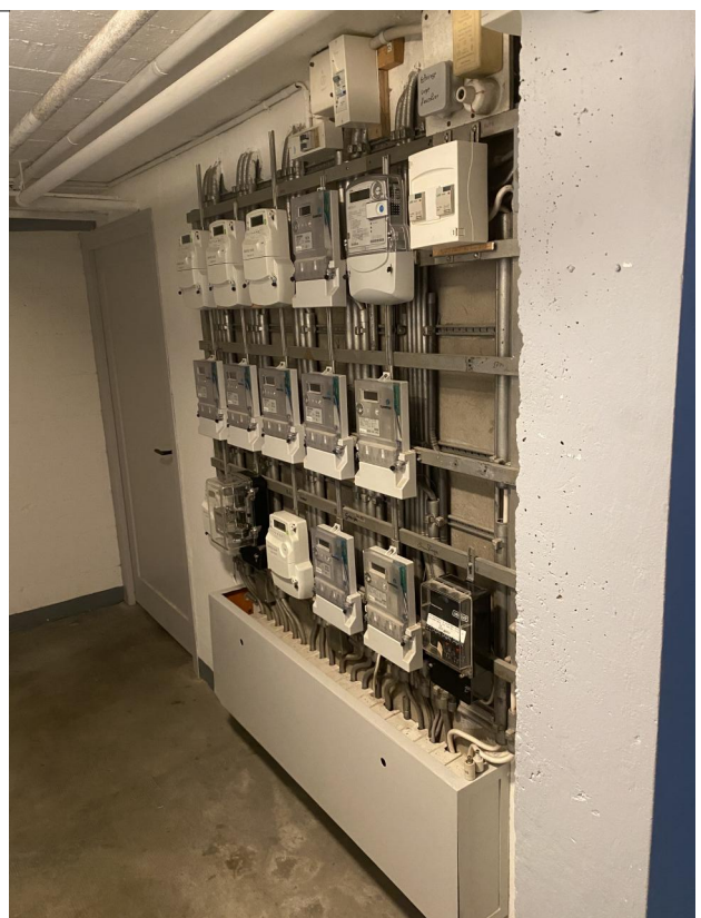
Tableau électrique entrée no.7