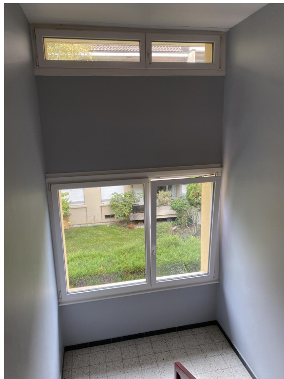
Ouvertures étage 2