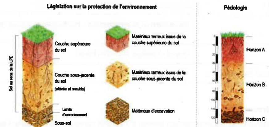
Figure 2 : Définitions du sol